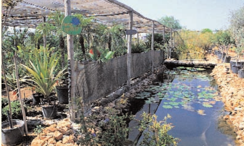
THE PORCHES GARDEN CENTRE DAS GARTENCENTER IN PORCHES

Natura verfügt über einen vollständigen Beratungsservice, der Gartendesigns ausführt oder Pläne für andere Firmen entwirft, wenn, wie im Fall eines Auftrags