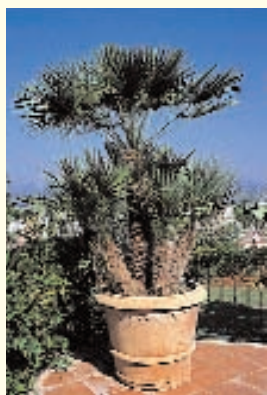
AN ITALIAN TERRACOTA POT WITH A LOCAL PALM TREE (CHAMAEROPS HUMILIS) EIN ITALIENISCHER TERRACOTTATOPF MIT DER HIESIGEN PALME (CHAMAEROPS HUMILIS)

►► attention. Each garden he designs is an individual project, a living work of art rather than an "off-the-shelf" standard design with lots of expensive shrubs to maximise profit. He aims to educate his clients about the environment and make them aware that they can play an important part in protecting it.