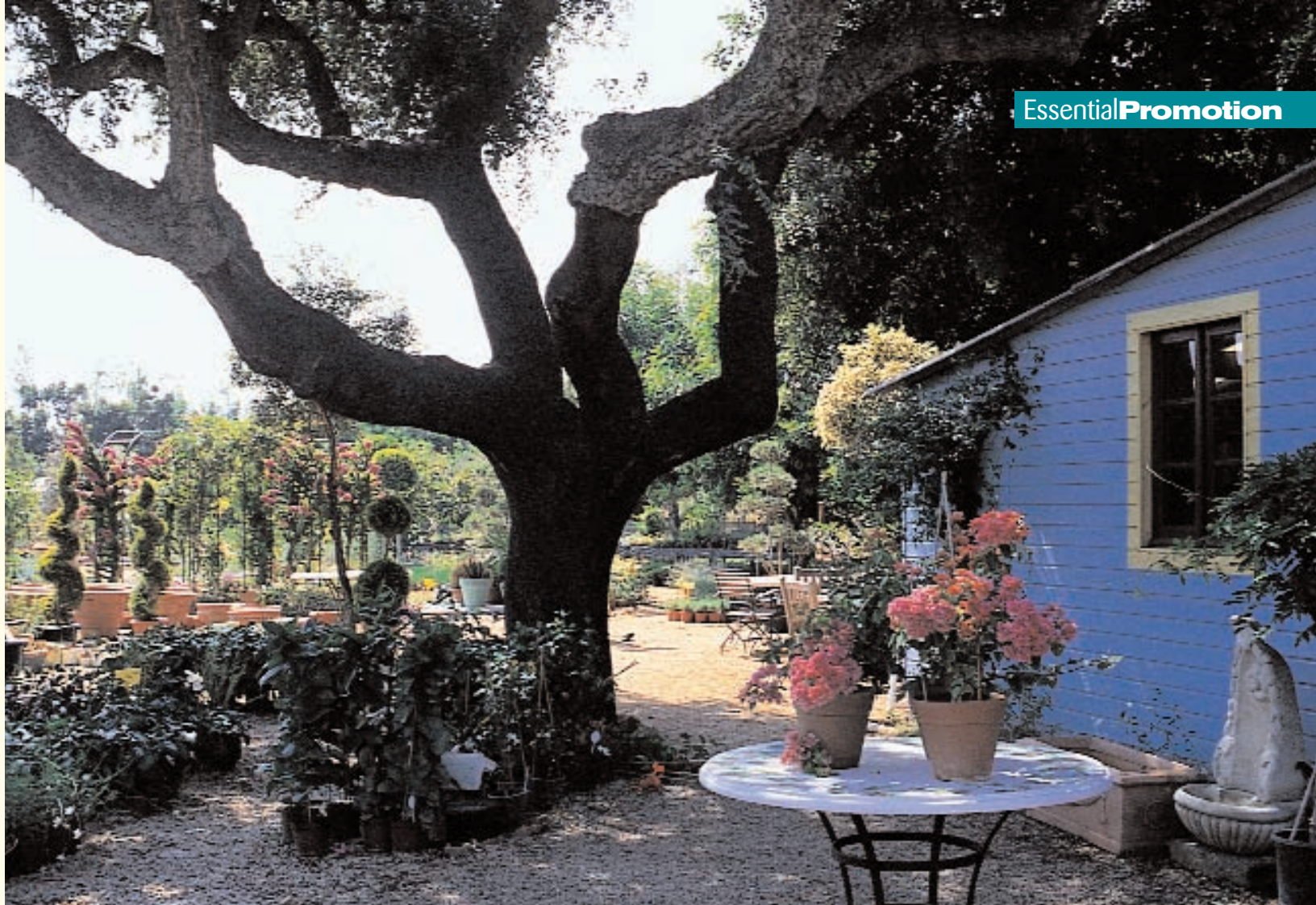
NATURA'S ALMANCIL GARDEN CENTRE NATURA'S GARTENCENTER IN ALMANCIL