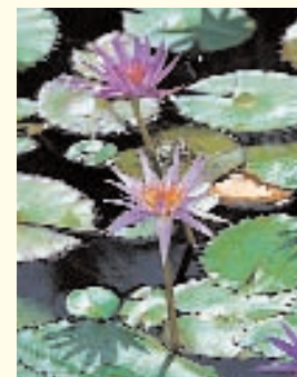
(LILLIES) NYMPHEA "BLUEBIRD" (LILIE) NYMPHEA "ROTKEHLHÜTTENSÄNGER"