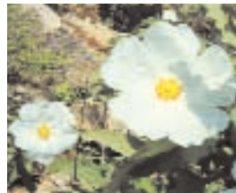
6. CISTUS ALBIDUS (+ 10)