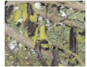
26. CERATONIA SILIQUA (+ 5)