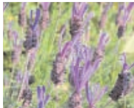
2. LAVANDULA DENTATA (+ 5)