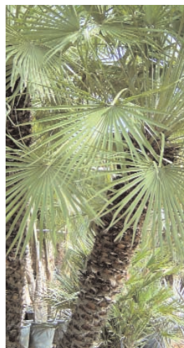
27. CHAMAEROPS HUMILIS (+ 5)