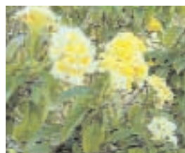
12. LANTANA CAMARA (- 10)