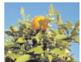
32. CITRUS (- 5)