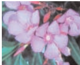
5. NERIUM OLEANDER (+ 5)