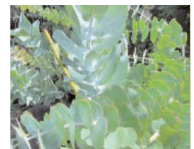
31. EUCALYPTUS (- 10)