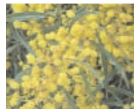
30. MIMOSA (- 10)