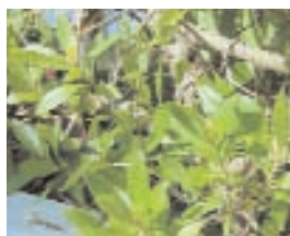
16. MYOPORUM (- 10)