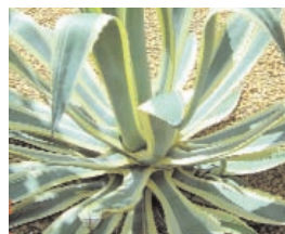
15. AGAVES (- 5)