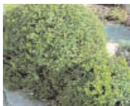
11. MYRTUS COMMUNIS (+ 10)