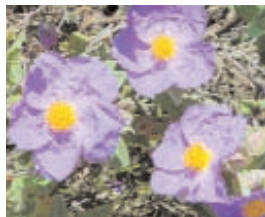
7. CISTUS LADANIFER (+ 10)