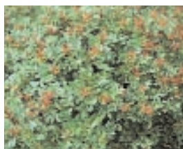
10. PISTACIA LENTISCUS (+ 10)