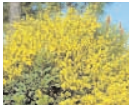
4. SPARTIUM JUNCEUM (+ 5)