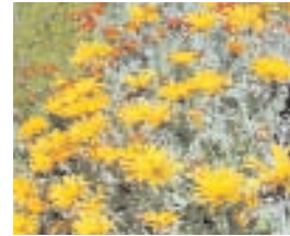
20. ARTOTIS (- 10)