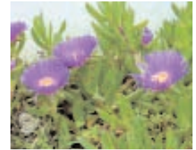
21. CAROBROTUS (- 10)