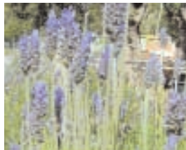
1. LAVANDULA STOECHAS (+ 5)

Nehmen Sie die nachstehende Liste an Pflanzen und Bäumen, wandern Sie durch Ihren Garten und kreuzen Sie die Arten an, die Sie finden. Dann zählen Sie die jeweiligen Punkte zusammen. Aber Achtung: Manche Arten bekommen Minuspunkte, weil sie den "cleveren Garten" Test nicht bestehen! Sie sind weder mediterran noch eingeboren, sondern „Exoten“ die Liebe, Hege und Pflege und jede Menge Wasser brauchen. Nicht sehr "clever"! Wenn Sie Ihre Punkte addiert haben (und die Minuspunkte abgezogen!) sehen Sie, zu welcher Kategorie Sie, bzw. Ihr Garten gehören.