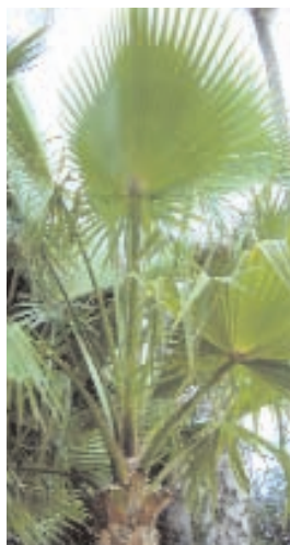
29. WASHINGTONIA (- 5)