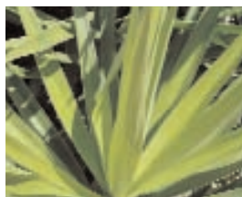
13. YUCCAS (- 5)