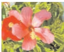
17. HIBISCUS CHINENSIS (- 5)