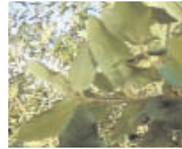
25. QUERCUS ILEX (+ 10)