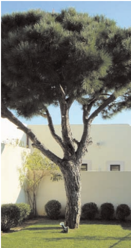
22. PINUS PINEA (+ 10)