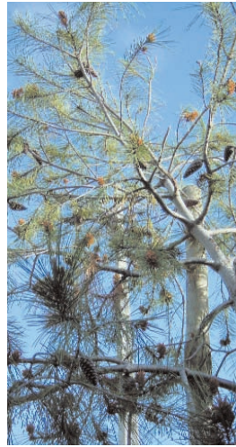
23. PINUS ALEPENSIS (+ 10)