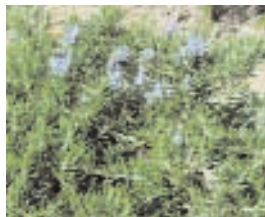
8. ROSMARINUS OFFICINALIS (+ 10)