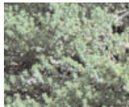
9. THYMUS VULGARIS (+ 10)