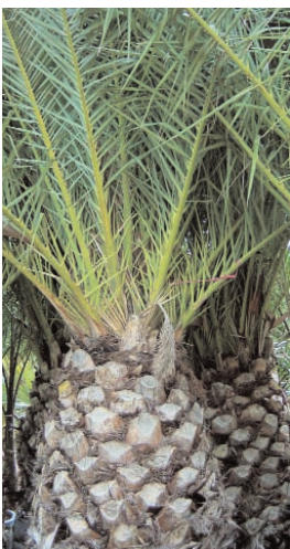
28. PHOENIX CANARIENSIS (- 5)