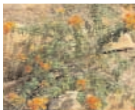
14. STREPTOSOLEN (- 5)