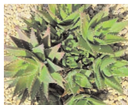
18. ALOES (- 5)