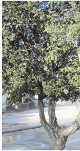
24. QUERCUS SUBER (+ 10)